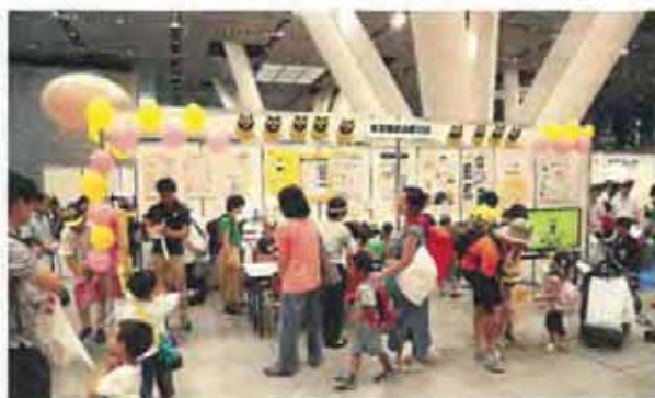
ブースを連結することも可能です。(こちらはBタイプ2つを連結させた事例です)