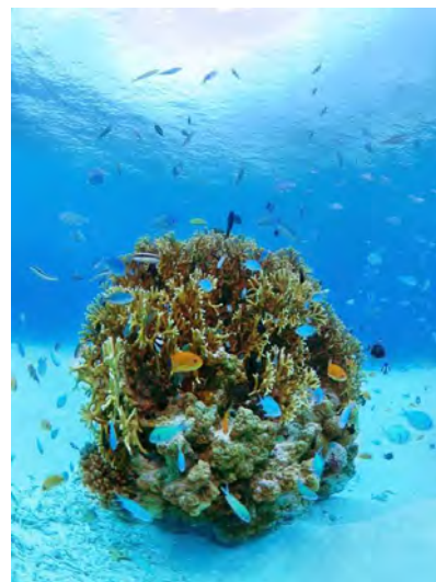
図2 写真部門最優秀賞 『小さなサンゴ礁』石原 嗣朗氏