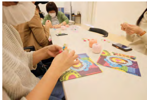
図6 イベントの様子