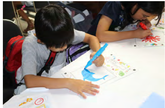
図4 出展イベントの様子②