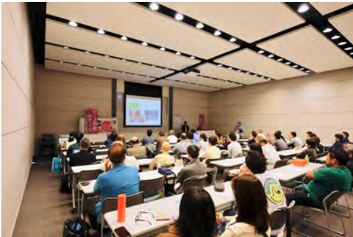
図5 シンポジウムの様子