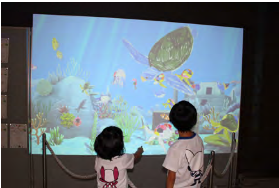
図3 出展イベントの様子①